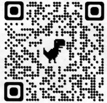
QR CODE สมัครอบรม จป.หัวหน้างาน