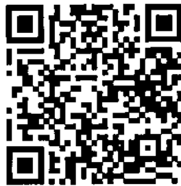
QR code สำหรับลงทะเบียน

ผู้ที่มีความประสงค์ร่วมนำเสนอผลงานวิจัยสามารถลงทะเบียนสมัครได้ที่ https://research.kpru.ac.th/std-conference๒ หรือทาง QR code ที่อยู่ด้านล่างนี้ โดยชำระค่าลงทะเบียน หลังการส่งบทความเข้าระบบ เพื่อเป็นการยืนยันการส่งบทความให้พิจารณาเข้าร่วมการประชุมวิชาการ