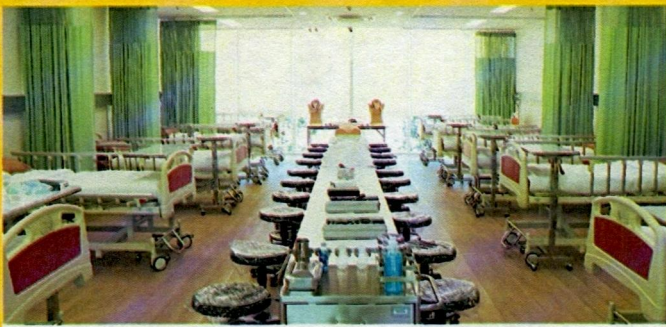
Fundamental Nursing Laboratory