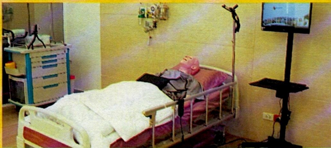
High-Fidelity Simulation Laboratory - Sim Man