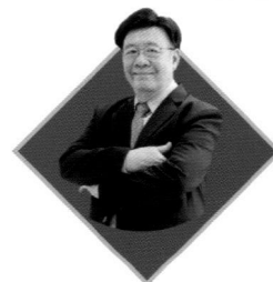
รศ.ดร.สมภพ มานะรังสรรค์ อธิการบดี สถาบันการจัดการปัญญาภิวัฒน์