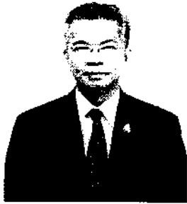
๑. นายรักษเกชา แฉ่ฉ่าย อดีตเลขาธิการสำนักงานผู้ตรวจการแผ่นดิน

หากท่านใดมีข้อมูล ข้อเท็จจริง และข้อคิดเห็นเกี่ยวกับบุคคลที่จะเข้ารับการศึกษา เป็นผู้สมควรได้รับการแต่งตั้งเป็นผู้ตรวจการแผ่นดิน