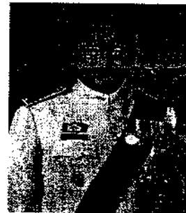
๔. นายกุลกมุท ลิ่งรหา ณ อยุธยา อดีตเอกอัครราชทูต ประจำกรุงโซล ประเทศเกาหลีใต้