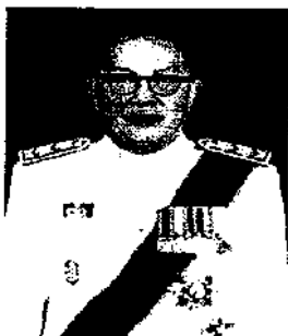
๕. นายธฤต จรุงวัฒน์ อดีตเอกอัครราชทูต ประจำกรุงอังการา สาธารณรัฐตุรกี