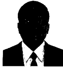
๘. พลเอก นิพัทธ์ ทองเล็ก อดีตปลัดกระทรวงกลาโหม