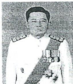
๓. นายณัฐจักร ปัทมสิงห์ ณ อยุธยา อัยการอาวุโส สำนักงานอัยการสูงสุด