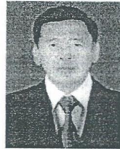
๘. พลโท สุรพงศ์ เปรมบุญญิติ อดีตหัวหน้าสำนักตุลาการทหาร และตุลาการพระธรรมนูญหัวหน้าศาลทหารสูงสุด