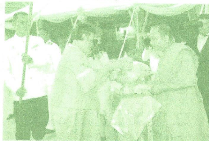
ท่านเจ้าคุณ ดร.พระสุนทรกิจโกศล (ป.ธ.๖, พ.ธ.๓) ถวายข้าวสุปายาส (ข้าวทิพย์) ปีที่ ๓๕ แก่สมเด็จพระเทพรัตนราชสุดาฯ สยามบรมราชกุมารี เสด็จพระราชดำเนินเปิดงานวันอาสาฬหบูชาโลกและทรงสุหรัยข้าวสุปายาส (ข้าวทิพย์)