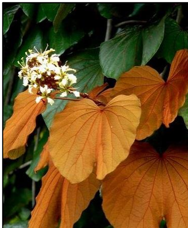
ภาพที่ 1.2 ต้นใบไม้สีทอง

ต้นไม้ประจำคณะวิทยาศาสตร์และเทคโนโลยี คือ ใบไม้สีทอง หรือ ต้นดาโ้ะ ชื่อวิทยาศาสตร์ Bauhinia aureifolia K.&S.Larsen เป็นไม้มงคล มีลักษณะเด่นตรงที่มีใบสีทองสวยงาม ดังภาพที่ 1.2